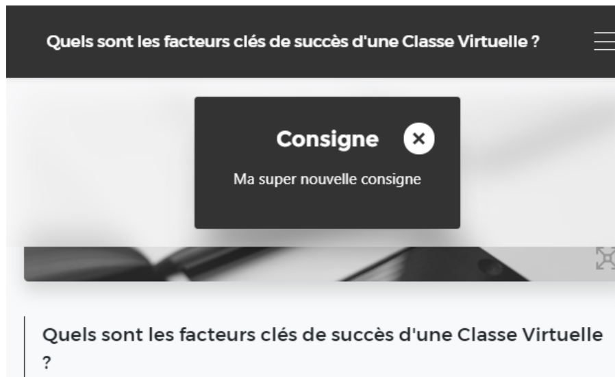
Img 1 : Ecran choice accessible avec consigne modifiée

ATTENTION : LES MODIFICATIONS APORTEES AUX CONSIGNES ACCESSIBLES CONCERNENT TOUS LES ECRANS DU MEME TYPE.